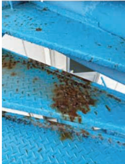
徳山興産(株)らせん階段 before